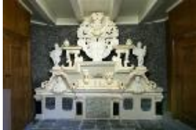
Monument in de kerk

De boerderij op Rijtseterp nummer 1 heeft al heel wat eigenaren gehad. In 1640 was de plaats eigendom van Watze van Camminga, Vrijheer van Ameland, en zijn vrouw Rixt van Donia. Beiden liggen trouwens begraven in een praalgraf in de kerk van Tjerkwerd. De plaats stond toen bekend als Stem N° 44 in het stemkohier. In oude akten wordt het land omschreven als "twee stukken greidland nae elxander gelegen te Ritseburen onder den Dorpe Tjerkwert, groot 72 pondematen ende beswaert met de huysinge, schuire, boomen ende plantagie".